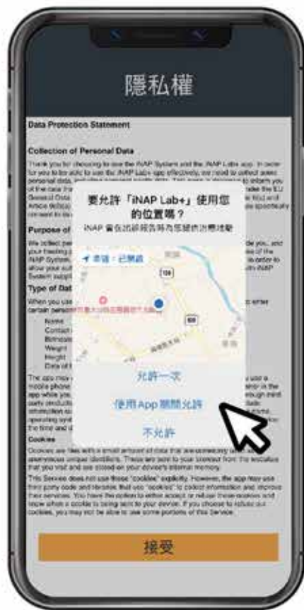
1. 允許存取所在位置