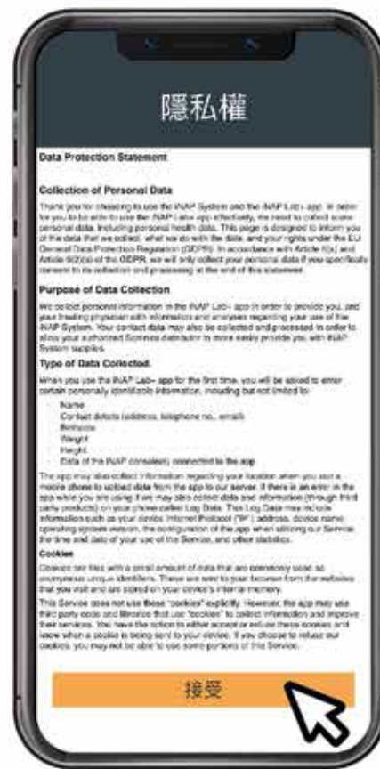
3. 詳閱隱私權政策並按下接受