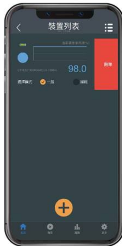
2. 左滑裝置即可刪除