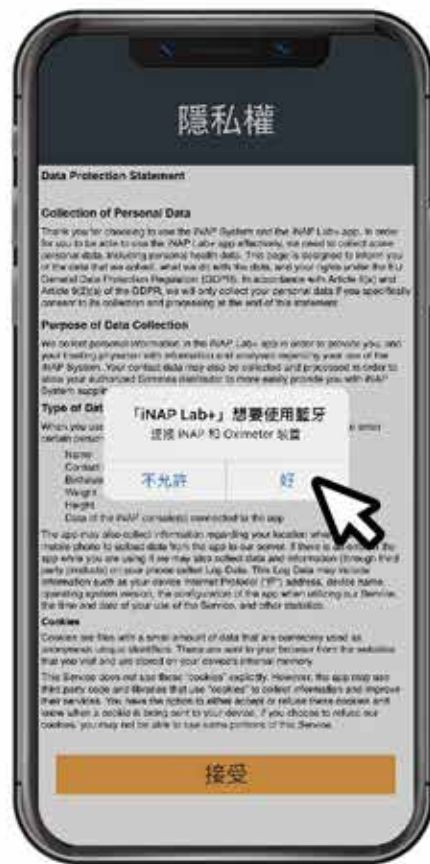
2. 允許藍芽連線APP裝置